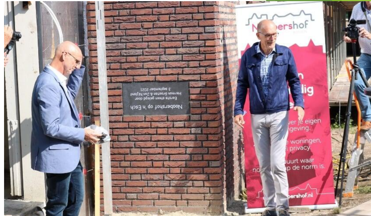
Noabershof op 'n Esch