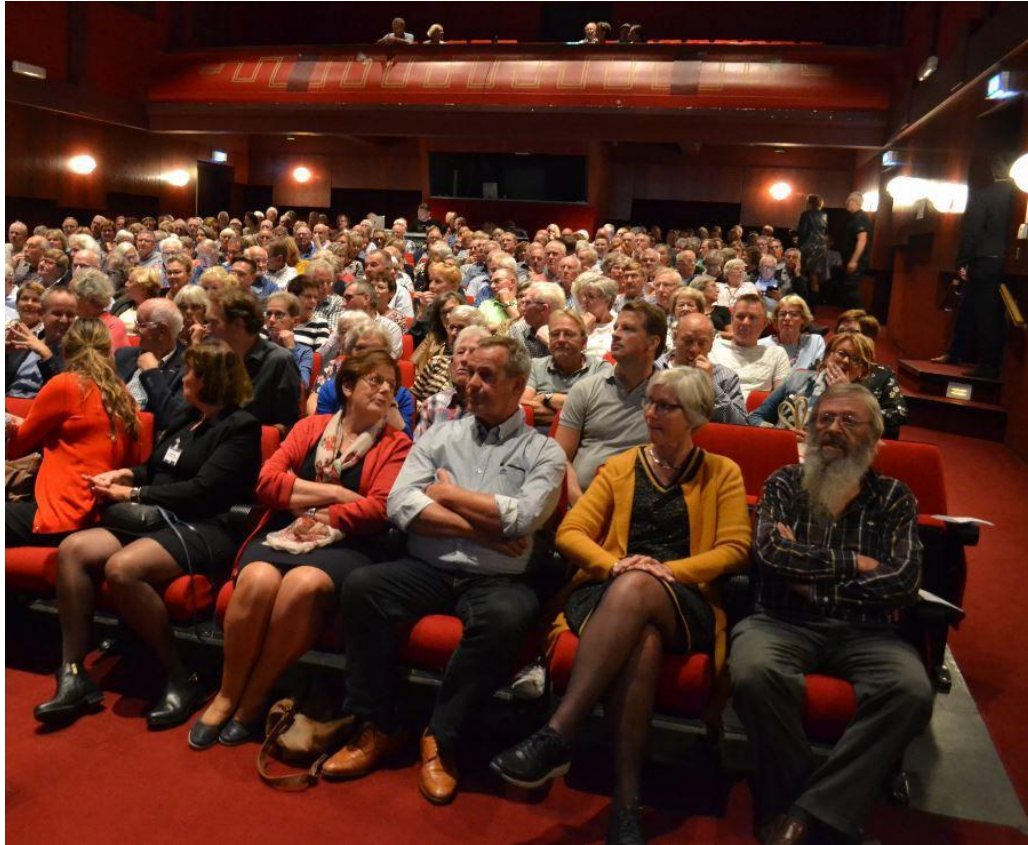
Informatieavond 16 oktober 2018