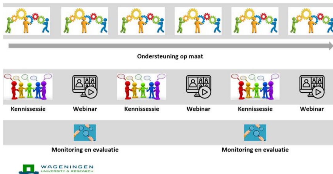
Figuur 2. Methoden en producten van het kennisuitwisselingstraject. We hebben participatief actieonderzoek (PAR) en realist evaluatie toegepast om de DSV's te faciliteren, monitoren en evalueren (M&E). Dit heeft onder andere geresulteerd in een overzicht van de werkzame elementen inclusief opbrengsten, inzicht in diversiteit, verschillen in focus van DSV's, bestuursstijlen en vormen van participatie en borging.

Methoden en producten zijn hand in hand ontwikkeld en bestaan onder meer uit ondersteuning op maat, drie Kennisdagen met alle DSV's, drie Webinars voor alle geïnteresseerden en twee Monitoring & Evaluatie sessies met elke DSV (zie Figuur 2).